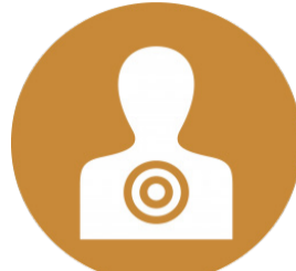
Explicação Professor é o centro