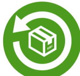
Projeto Ex.: um novo produto