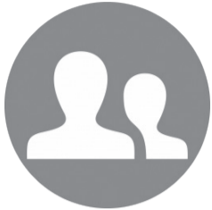
Palestra Ex.: Empresas