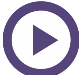
Prática "Mão na massa"