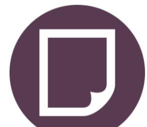
Avaliação Ex.: Prova