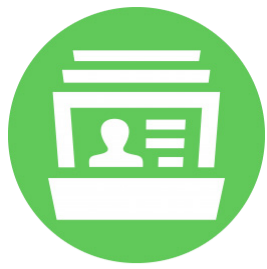
Materiais de apoio Ex.: Apostilas