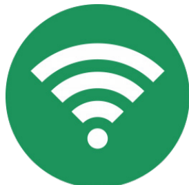
Recursos Ex.: Internet